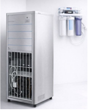
304 KALİTE KROM İÇ KAZAN